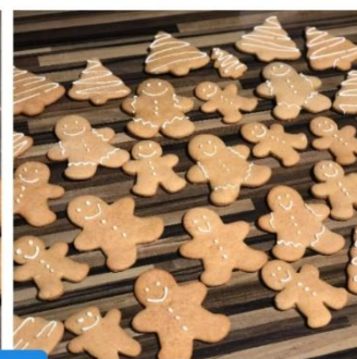
Blaz Kolar 7.a