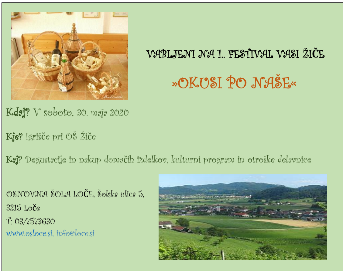
Slika 8: Letak za festival »Okusi po naše« (Maja Ogrizek)