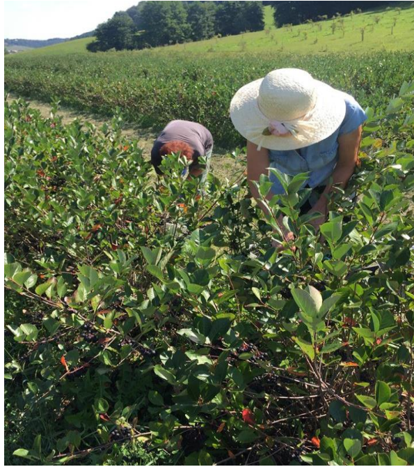
Slika 4: Obiranje aronije na kmetiji Ratajc ( https://publishwall.si/mojakmetija/post/420274/aronija )