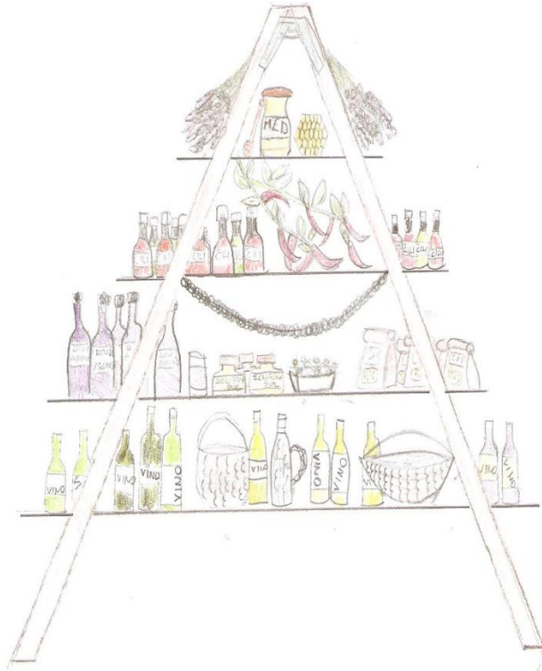
Risba 2: Turistična stojnica v Velenju (Zala Šmid)

Na stojnici bomo s slikovnim gradivom in z izdelki lokalnih pridelovalcev predstavili pomen turistične ponudbe v vasi Žiče. Pojasnili bomo idejo o kulinarinem festivalu, ki se nam je porodila prav zaradi pestrosti ponudbe naših sodelujočih kmetij in družin. Dogajanje na stojnici bomo popestrili z degustacijami domačih izdelkov, s kvizom in z maskoto vinogradnika, ki bo glasno vabil obiskovalce, da se ustavijo pri naši stojnici in kaj novega ter zanimivega izvedo.