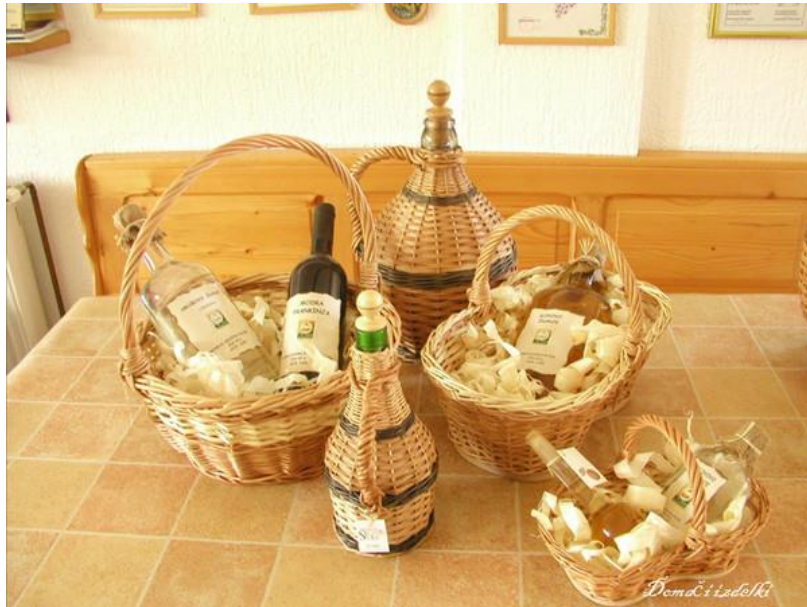
Slika 3: Domači izdelki

(http://www.podezelje.com/vsebina/pletarstvo-kalsek/82/)