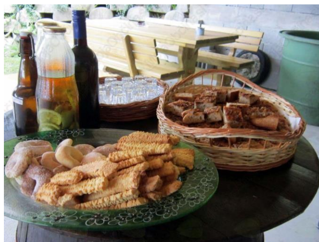
Slika 1: Ocvirkovka in piškoti

Med vinogradi Žičke gorce se nahaja Čerjakova gorca. Nekdaj malo zidanico so lastniki preuredili v objekt, ki ponuja prostor za zabave in zaključene družbe. Sprejmejo do 30 gostov. S kozarčkom domačega vina ali soka se lahko gostje sprostijo ob pogledu na neokrnjeno naravo. V Čerjakovi gorci gostom ponujajo kosila, domače vino ter ocvirkovko.