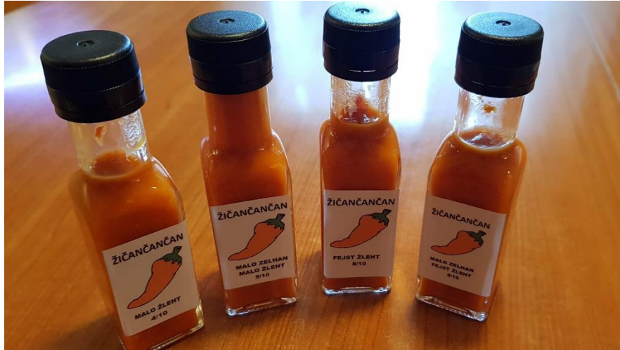
Slika 6: Čili omake (Dorjan Zabukovšek)

V družini Zabukovšek se ljubiteljsko ukvarjajo s pridelavo čilija. Doma imajo v nasadu okrog 40 vrst sadik čilija. Iz njih pridelajo štiri vrste različno pekočih omak.