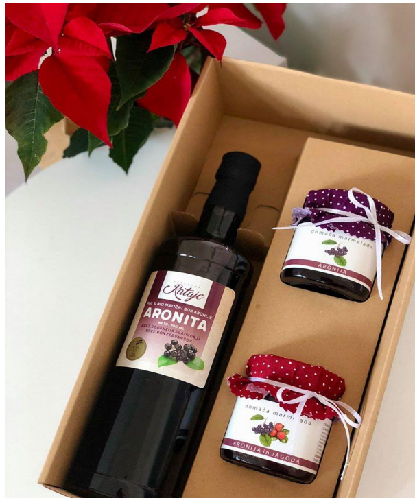
Slika 5: Sok in marmelada ( https://www.facebook.com/aronijaaronita/photos/a.116532332341902/282524155742718/?type=3&theater )