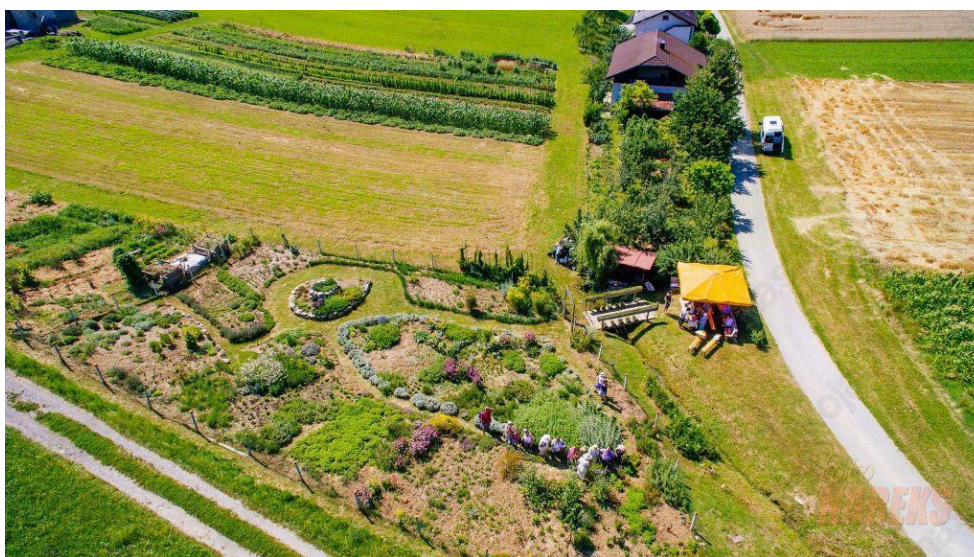
Slika 2: Zeliščni vrt Majnika

Zeliščni vrt je namenjen ogledom, izobraževalnim dejavnostim in prodaji zelišč, ki jih vzgajajo na biodinamičen način.