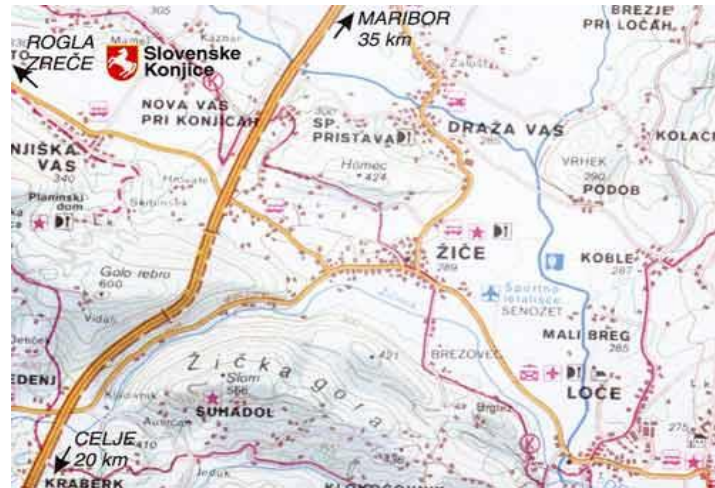
Zemljevid 2

Slovenskim Konjicam in skozi sotesko Sotensko proti Špitaliču. Žiče sodijo v občino Slov. Konjice in imajo status samostojne krajevne skupnosti. Prebivalci, ki jih je okoli 500, žive predvsem od kmetijstva ali pa so zaposleni v okoliških večjih krajih. Najbolj je razširjena živinoreja in v zadnjih letih tudi vinogradništvo.